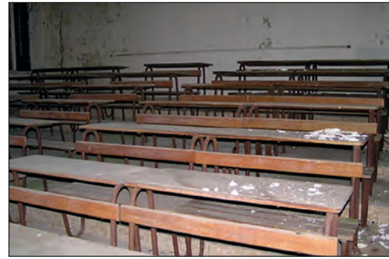
Un amphi en 2009.

L'Histoire se poursuit, l'École connaît de nombreuses évolutions marquées par les régimes politiques. Ainsi, les convulsions révolutionnaires eurent-elles un heureux effet pour la bibliothèque : en 1793, tragique année des débuts de la Terreur, les ouvrages provenant de la confiscation des biens du clergé et de ceux des émigrés, dont quatre incunables, vinrent enrichir le fonds anciennement constitué par les contributions des élèves et l'héritage d'une partie de la collection du second médecin Cuvillier, décédé en 1780. En 1794, la bibliothèque occupait un appartement du rez-de-chaussée. En 1798, un règlement l'institua officiellement.