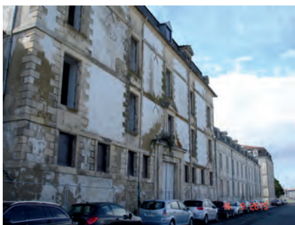
L'hôpital Charente aujourd'hui (façade Est).

Le 13 avril 1689 fut promulguée l'ordonnance considérée comme le premier code de la Marine militaire . Elle organisait dans son livre XX le service médical des hôpitaux et jetait les bases de la formation des chirurgiens entretenus (pour rémunérés, employés) par la Marine. Elle contenait le germe des futures Écoles d'anatomie et de chirurgie (à l'origine, les deux termes ont été employés). À cette époque, la population rochefortaise payait un lourd tribut à l'insalubrité des rues et des logements, et à la proximité des marais. En poste depuis 1688, Michel Bégon , quatrième intendant de la ville, dut faire face, entre autres, à la terrible épidémie de fièvre pourprée de 1693-94 qui fit quelques 3 000 morts. C'est pendant cette épidémie qu' Antoine Gallot devint premier médecin du port (on lit aussi de l'arsenal, ou encore de la Marine). Avec l'appui de Michel Bégon, aussi administrateur de la province