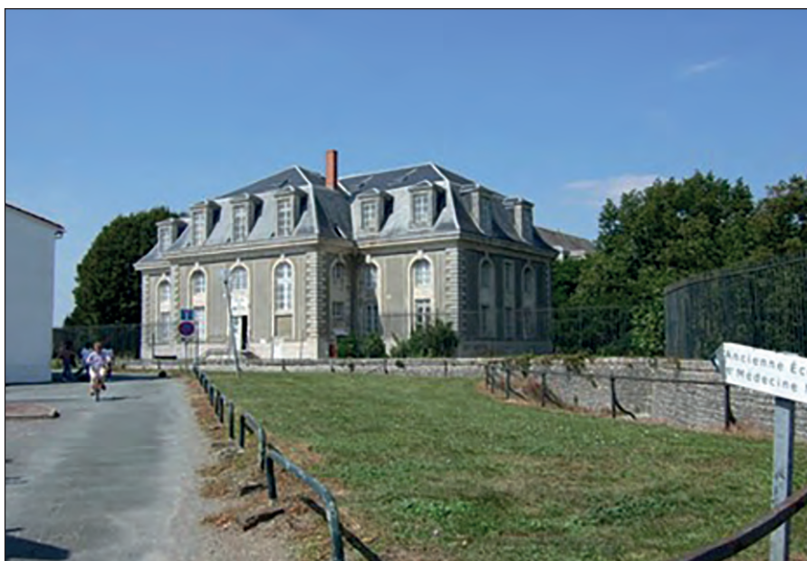
L'école en 2009.

Un certain nombre de fidèles de la Révolution et de l'Empire furent victimes d'une épuration au moment de la Restauration, mais le régime apporta par ailleurs quelques améliorations : obligation d'être bachelier pour prétendre à l'entretien,