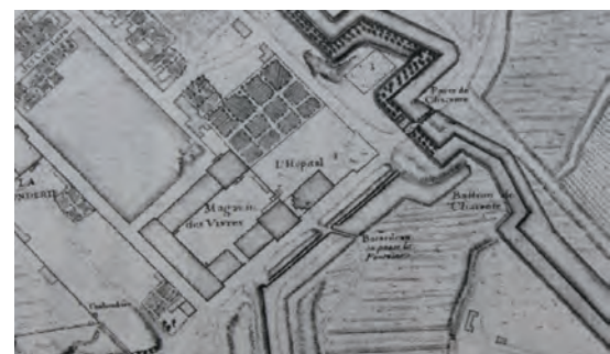
Plan de 1688. Le pavillon le plus au nord, l'hôtel de Mars, n'existait pas encore.

Le bon fonctionnement de l'hôpital reposait sur une organisation complexe assez proche de ce qui existe aujourd'hui : en haut de l'échelle, l'intendant de la Marine assurait la direction générale ; il était assisté d'un secrétaire appelé écrivain et d'un commissaire en charge de la gestion. Les services généraux étaient confiés à un économiste, des servants, un cuisinier, une lingère, un portier. L'équipe médicale comme nous le dirions aujourd'hui, comportait le médecin du port, premier médecin de la Marine, assisté d'un second médecin ; le chirurgien-major, assisté d'un aide-major, d'un chirurgien ordinaire et de cinq aides-chirurgiens ; le maître apothicaire, premier apothicaire de la Marine, assisté d'un second apothicaire. Outre leurs fonctions hospitalières, le premier médecin et le chirurgien-major étaient en charge, en collaboration avec le commissaire, de l'examen des candidats aux fonctions de chirurgien de la Marine. Une ordonnance royale de 1642 imposait en effet la présence d'un chirurgien à bord des vaisseaux de Sa Majesté. Le premier médecin et le chirurgien-major avaient par ailleurs une tâche de formation de leurs aides. Le service infirmier était assuré par un personnel masculin à gages mais surtout par les Sœurs de la Charité (ordre créé par St-Vincent de Paul en 1630), dirigées par une supérieure, son assistante, une économiste et une dépensière. La direction spirituelle des